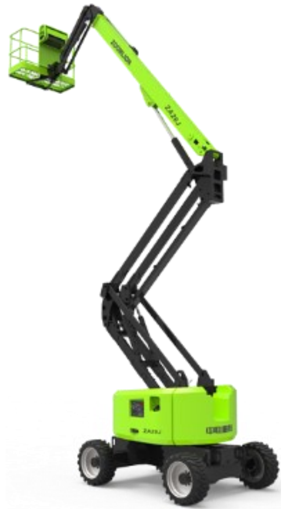
Range of Motion Z20J